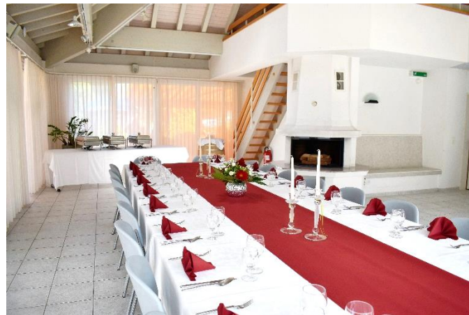
Blick in den Eventraum Pavillon